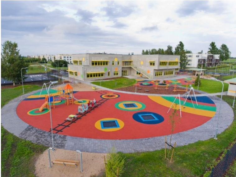
Ripsiku maja

Raadi Lasteaed Ripsik asub kahes hoones. Kuus rühma asub Ripsiku majas ja kuus rühma Nupsiku majas.